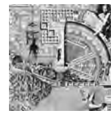
Aldo Rossi, La città analogica (1976)